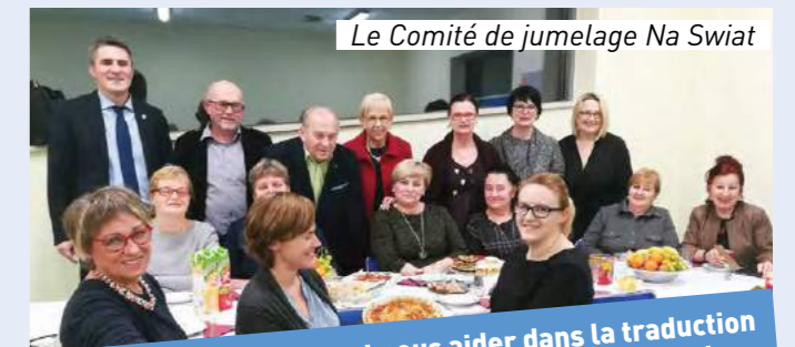
Le Comité de jumelage Na Swiat

Pour prendre connaissance du journal : http://www.celestynow.pl/161-Celestynka.htm