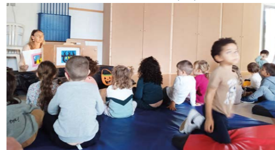
Intervention des assistantes maternelles de Clapiers