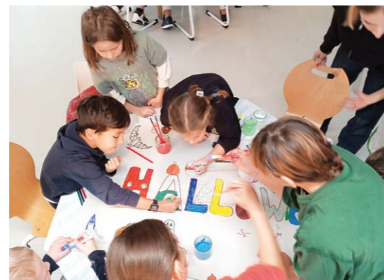
On prépare Halloween !