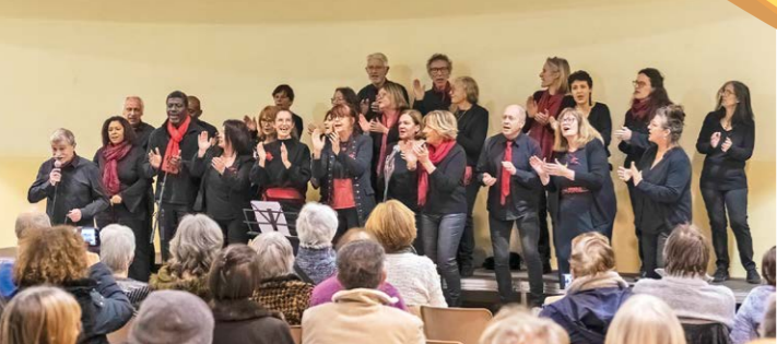
La chorale Clap'Yes