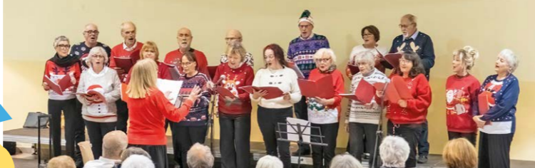
La chorale Alegria