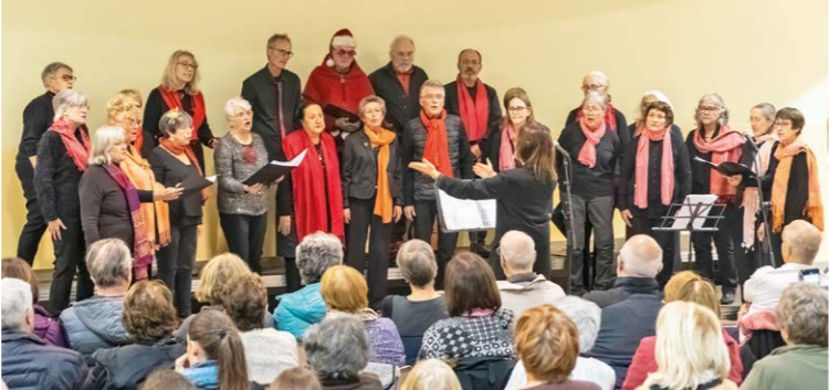
La chorale Clarpège et ses amis

Plus d'une centaine de personnes sont venues écouter ces formations musicales clapiéroises aux styles très différents. Ce qui a fait l'originalité de la soirée, ce furent les chants communs à deux chorales, sans parler du final : un chant réunissant les quatres chorales. L'impossible est devenu réalité grâce aux choristes et à leur chef de chœur. La soirée très chaleureuse a été marquée par la complicité nouée entre les chorales et le public.