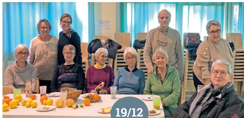
Atelier biscuits de Noël