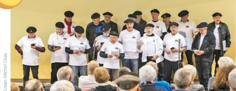
La chorale Lo Cocut