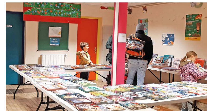
Lire et grandir à Clapiers

Grâce à la mobilisation de l'école, des élèves et des parents qui ont massivement soutenu la manifestation, la vente proposée après la classe aux familles qui le souhaitaient a attiré un public nombreux, et ce fut un sympathique moment d'échange avec les bénévoles qui organisaient ces journées. Sa réussite permettra à l'association de recevoir un bon nombre de livres pour enrichir le fonds mis à disposition des élèves, en s'appuyant sur les choix des enseignants. Cette manifestation permet aux enfants de lire et grandir à travers les livres qu'ils ont choisis. Un grand merci à tous.